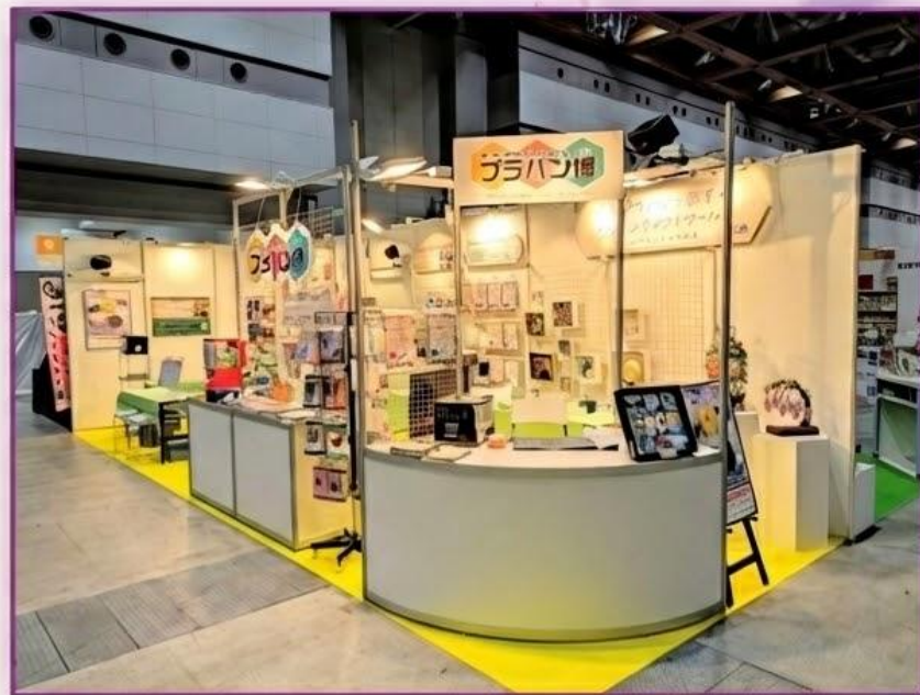
(前回2025年のブース出展イメージ)